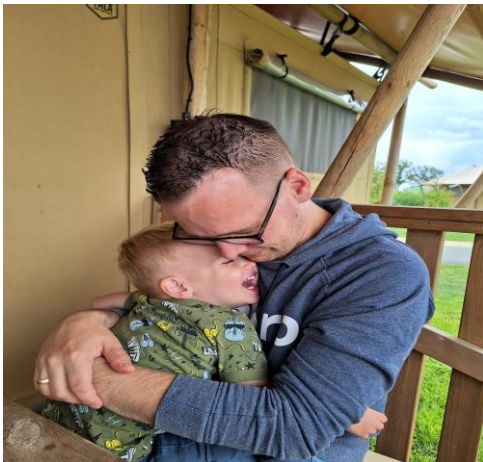
aandacht en affectie – vader en zoon